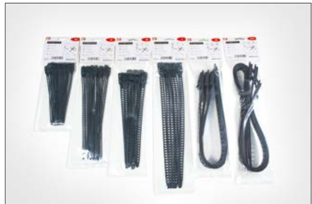
Die SOFTFIX Familie ist in praktischen Kleinverpackungen erhältlich.