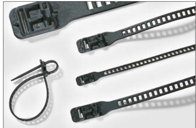
Elastisch und vielseitig einsetzbar. Die SRT- und SOFTFIX-Kabelbinder.

i Mit zweiter Verriegelung für parallele Bündelung!