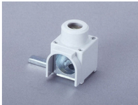
31028 Anschlussklemme, seitlicher Anschluss für 31014, 31024, 31309, 31311 6 - 50 mm 2