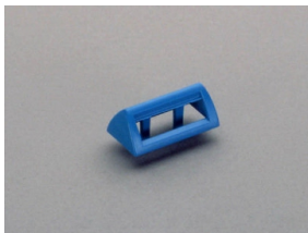
31086 Bezeichnungsschildträger für Triton, ansteckbar