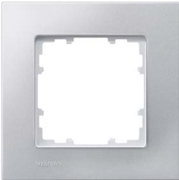
DELTA MIRO RAHMEN 1-FACH FARBE ALUMINIUMMETALLIC ABMESSUNGEN 90X90MM