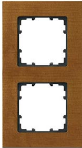
MIRO RAHMEN 2-FACH HOLZ KIRSCHENFARBTON DURCH BEIZUNG