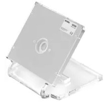
40596 - Tischgehäuse Tab 7 Up