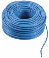
732H.E.500 - 2F+ PVC-Kabel Innenverlegung Eca 500m