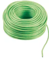
732I.E.100 - 2F+ LSZH-Kabel 2x1 Außenverleg.Eca 100m