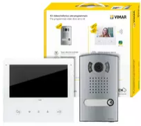
K40517.E - Set Video 1-Fam.Tab 7S Up Wi-Fi+1300E