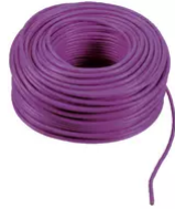
732I.C.100 - 2F+ Kabel 2x1 LSZH Cca 100m blaurot