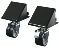
8100700 VX Transportrolle