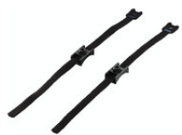
5502155 Klettbandhalter zur schnellen Fixierung von Kabeln, werkzeuglos, RAL9005