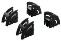
5502405 Kabelmanager, RAL 9005