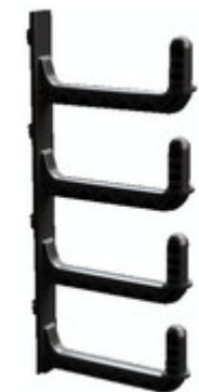
5502115 Kabelfinger, 6 HE zur HE bezogenen Kabelführung, RAL 9005