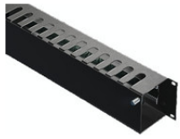
5502235 Rangierpanel, 2 HE, RAL 9005