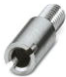
Prüfsteckerbuchse, Farbe: silberfarben

Prüfsteckerbuchse - PSB 3/10/4 - 0601292