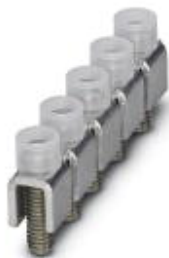
Feste Brücke, Rastermaß: 15 mm, Polzahl: 5, Farbe: silberfarben

Bitte beachten Sie, dass die hier angegebenen Daten dem Online-Katalog entnommen sind. Die vollständigen Informationen und Daten entnehmen Sie bitte der Anwenderdokumentation. Es gelten die Allgemeinen Nutzungsbedingungen für Internet-Downloads. ( http://phoenixcontact.de/download )