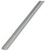
Endlossteckbrücke, Länge: 500 mm, Farbe: grau

Endlossteckbrücke - FBST 500-PLC GY - 2966838