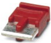
Einzelsteckbrücke, Länge: 6 mm, Polzahl: 2, Farbe: rot

Einzelsteckbrücke - FBST 6-PLC RD - 2966236