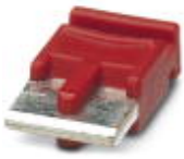
Einzelsteckbrücke, Länge: 6 mm, Polzahl: 2, Farbe: rot

Einzelsteckbrücke - FBST 6-PLC RD - 2966236