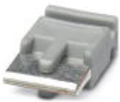
Einzelsteckbrücke, Länge: 6 mm, Polzahl: 2, Farbe: grau

Einzelsteckbrücke - FBST 6-PLC GY - 2966825