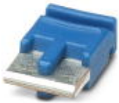
Einzelsteckbrücke, Länge: 6 mm, Polzahl: 2, Farbe: blau

Einzelsteckbrücke - FBST 6-PLC BU - 2966812