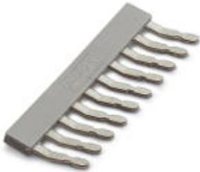
Einlegebrücke, Rastermaß: 5,2 mm, Polzahl: 10, Farbe: grau

Bitte beachten Sie, dass die hier angegebenen Daten dem Online-Katalog entnommen sind. Die vollständigen Informationen und Daten entnehmen Sie bitte der Anwenderdokumentation. Es gelten die Allgemeinen Nutzungsbedingungen für Internet-Downloads. ( http://phoenixcontact.de/download )