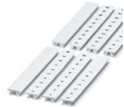
Abbildung zeigt die Varianten ZB 7,62 - UNBEDRUCKT, -LGS:FORTL.ZAHLEN, und -CUS

http://eshop.phoenixcontact.de/phoenix/treeViewClick.do?UID=1050509