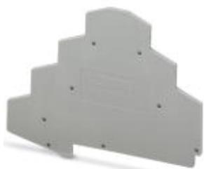
Abschlussdeckel, Länge: 98,5 mm, Breite: 2,2 mm, Höhe: 73 mm, Farbe: grau

Bitte beachten Sie, dass die hier angegebenen Daten dem Online-Katalog entnommen sind. Die vollständigen Informationen und Daten entnehmen Sie bitte der Anwenderdokumentation. Es gelten die Allgemeinen Nutzungsbedingungen für Internet-Downloads. ( http://phoenixcontact.de/download )