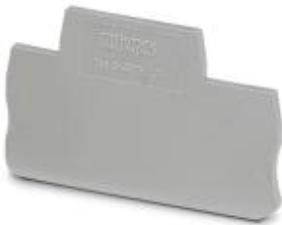
Abschlussdeckel, Länge: 67,5 mm, Breite: 2,2 mm, Höhe: 47,5 mm, Farbe: grau

Bitte beachten Sie, dass die hier angegebenen Daten dem Online-Katalog entnommen sind. Die vollständigen Informationen und Daten entnehmen Sie bitte der Anwenderdokumentation. Es gelten die Allgemeinen Nutzungsbedingungen für Internet-Downloads. ( http://phoenixcontact.de/download )