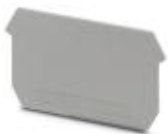
Abschlussdeckel, Länge: 63,5 mm, Breite: 1,5 mm, Höhe: 35,9 mm, Farbe: grau