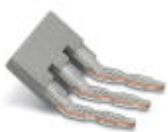
Einlegebrücke, Rastermaß: 6,2 mm, Polzahl: 3, Farbe: grau