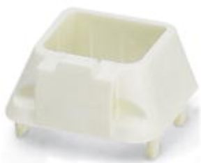
Security-Rahmen für SFN Switch und Patchfelder, weiß

Bitte beachten Sie, dass die hier angegebenen Daten dem Online-Katalog entnommen sind. Die vollständigen Informationen und Daten entnehmen Sie bitte der Anwenderdokumentation. Es gelten die Allgemeinen Nutzungsbedingungen für Internet-Downloads. ( http://phoenixcontact.de/download )