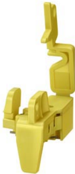
ABSPERRVORRICHTUNG FUER GRIFF FUER LS-SCHALTER