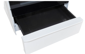
Schublade Schublade für zusätzlichen Stauraum.