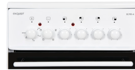
Bedienblende ohne Uhr Übersichtliche Bedienelemente