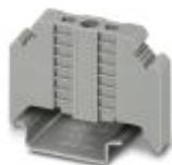
Endhalter, Breite: 9,5 mm, Farbe: grau