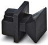
Staubschutzkappen für RJ45-Buchse

Staubschutz - FL RJ45 PROTECT CAP - 2832991