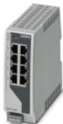
Managed Switch 2000, 8 RJ45-Ports 10/100/1000 MBit/s , Schutzart IP20

Bitte beachten Sie, dass die hier angegebenen Daten dem Online-Katalog entnommen sind. Die vollständigen Informationen und Daten entnehmen Sie bitte der Anwenderdokumentation. Es gelten die Allgemeinen Nutzungsbedingungen für Internet-Downloads. ( http://phoenixcontact.de/download )