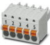
Steckerteil, Nennstrom: 8 A, Bemessungsspannung (III/2): 160 V, Polzahl: 5, Rastermaß: 3,81 mm, Anschlussart: Push-in-Federanschluss, Farbe: grau, Kontaktoberfläche: Zinn

Leiterplattensteckverbinder - FK-MCP 1,5/ 5-ST-3,81 GY - 1884005