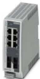
Managed Switch 2000, 6 RJ45-Ports 10/100 MBit/s, 2 SC-Multimode 100 MBit/s, Schutzart IP20

Bitte beachten Sie, dass die hier angegebenen Daten dem Online-Katalog entnommen sind. Die vollständigen Informationen und Daten entnehmen Sie bitte der Anwenderdokumentation. Es gelten die Allgemeinen Nutzungsbedingungen für Internet-Downloads. ( http://phoenixcontact.de/download )