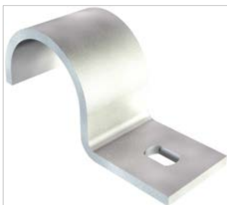
Einlippige Befestigungsschelle für Kabel und Rohre