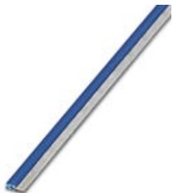
Endlossteckbrücke, Länge: 500 mm, Farbe: blau

Bitte beachten Sie, dass die hier angegebenen Daten dem Online-Katalog entnommen sind. Die vollständigen Informationen und Daten entnehmen Sie bitte der Anwenderdokumentation. Es gelten die Allgemeinen Nutzungsbedingungen für Internet-Downloads. ( http://phoenixcontact.de/download )