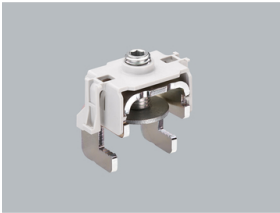
33 740 Klemmbügel für QUADRON®185Power für System ohne Berührungsschutz Größe 1 - 3 NEU