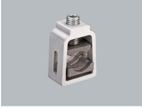
33 736 Rahmenklemme Größe 1-3 NEU