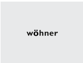
33 746 Stromwandler 250 A / 5 A 2,5 VA / Klasse 1 Größe 1 - 3 NEU