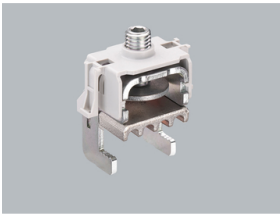
33 738 Klemmbügel für QUADRON®185Power für berührungsgeschütztes System Größe 1 - 3 NEU