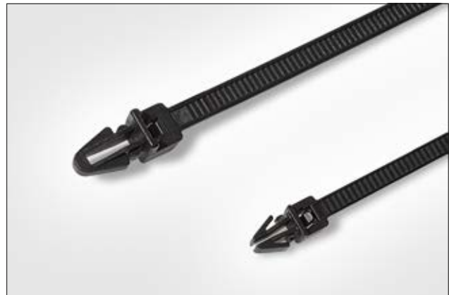
Bei engen Einbauverhältnissen eignen sich besonders die Kabelbinder T30RSF und T50RSF.