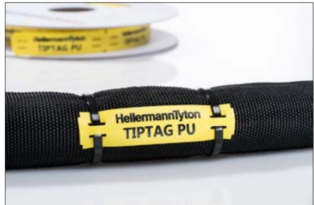
TIPTAG PU – dauerhaft bedruckbares Kennzeichnungsschild für raue Bedingungen.