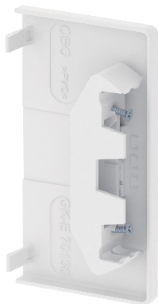
Endstück zum Verschließen der GK Geräteeinbaukanäle.