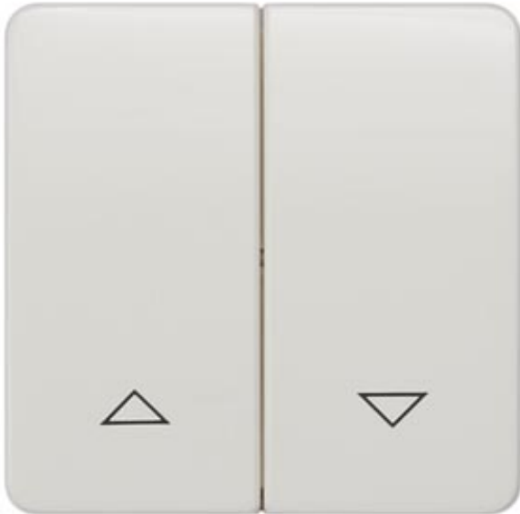
DELTA PROFIL, TITANWEISS WIPPE MIT JALOUSIESYMBOLEN FUER JALOUSIETASTER, 65X65MM