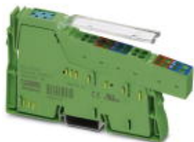
Inline-Digital-Eingabeklemme, komplett mit Zubehör (Anschlussstecker und Beschriftungsfeld), 4 Eingänge, 24 V DC, 3-Leiter-Anschluss-technik

Bitte beachten Sie, dass die hier angegebenen Daten dem Online-Katalog entnommen sind. Die vollständigen Informationen und Daten entnehmen Sie bitte der Anwenderdokumentation. Es gelten die Allgemeinen Nutzungsbedingungen für Internet-Downloads. ( http://phoenixcontact.de/download )