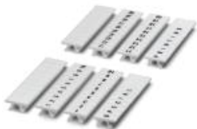
Abbildung zeigt die Varianten ZB 3,5:UNBEDRUCKT, - LGS:FORTL.ZAHLEN, - QR:FORTL.ZAHLEN und CUS

Zackband, 10-teilig, längs bedruckt mit den fortlaufenden Zahlen: 1 ... 10, weiß, Breite: 3,5 mm