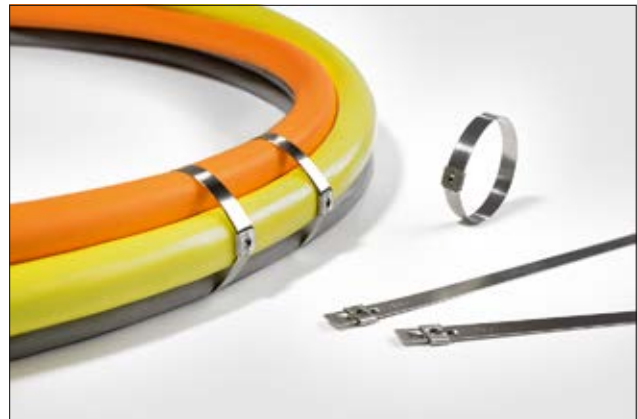
Edelstahlkabelbinder der MST-Serie für besonders raue Umgebungen.