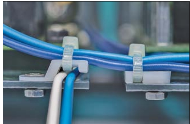
TY- (l) und MB-Serie (r) mit gebogenem Design, schraubbar.