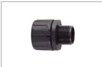
HelaGuard HG-S, gerade Verschraubung mit Außengewinde.

Verschraubungen mit UNEF- und NPT-Gewinde auf Anfrage erhältlich. Fragen Sie uns!