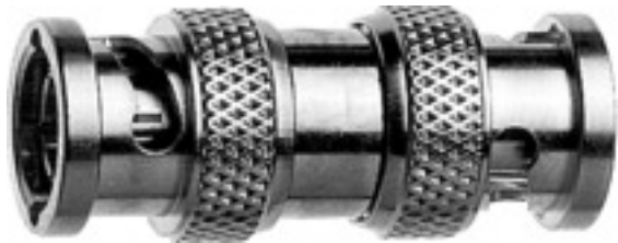
Abb. kann abweichen