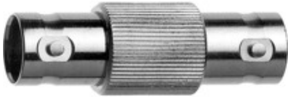
Abb. kann abweichen