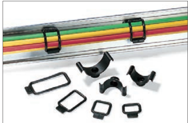
Befestigungsschellen Cradle Clip