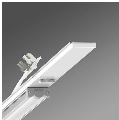
Lichttechnik freistrahlend-direkt freistrahlend SDGV LED 4200 lm 840