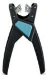
Abisolierzange, für AS-Interface-Flachleitungen, Abisolierlänge beliebig

Bitte beachten Sie, dass die hier angegebenen Daten dem Online-Katalog entnommen sind. Die vollständigen Informationen und Daten entnehmen Sie bitte der Anwenderdokumentation. Es gelten die Allgemeinen Nutzungsbedingungen für Internet-Downloads. ( http://phoenixcontact.de/download )