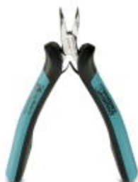
Elektronik-Spitzzange, gebogen 45°, Greiffläche glatt, mit Öffnungsfeder

Bitte beachten Sie, dass die hier angegebenen Daten dem Online-Katalog entnommen sind. Die vollständigen Informationen und Daten entnehmen Sie bitte der Anwenderdokumentation. Es gelten die Allgemeinen Nutzungsbedingungen für Internet-Downloads. ( http://phoenixcontact.de/download )