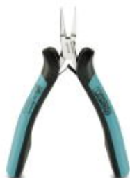
Elektronik-Flachzange, Greiffläche glatt, mit Öffnungsfeder

Bitte beachten Sie, dass die hier angegebenen Daten dem Online-Katalog entnommen sind. Die vollständigen Informationen und Daten entnehmen Sie bitte der Anwenderdokumentation. Es gelten die Allgemeinen Nutzungsbedingungen für Internet-Downloads. ( http://phoenixcontact.de/download )