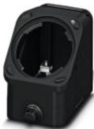
HEAVYCON EVO-Tüllengehäuse aus Kunststoff, mit Bajonettflansch für die EVO-Verschraubung, B10, für Längsbügel, Höhe 60,5 mm, ohne EVO-Verschraubung

Bitte beachten Sie, dass die hier angegebenen Daten dem Online-Katalog entnommen sind. Die vollständigen Informationen und Daten entnehmen Sie bitte der Anwenderdokumentation. Es gelten die Allgemeinen Nutzungsbedingungen für Internet-Downloads. ( http://phoenixcontact.de/download )