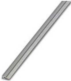
Endlossteckbrücke, Länge: 500 mm, Farbe: grau

Bitte beachten Sie, dass die hier angegebenen Daten dem Online-Katalog entnommen sind. Die vollständigen Informationen und Daten entnehmen Sie bitte der Anwenderdokumentation. Es gelten die Allgemeinen Nutzungsbedingungen für Internet-Downloads. ( http://download.phoenixcontact.de )