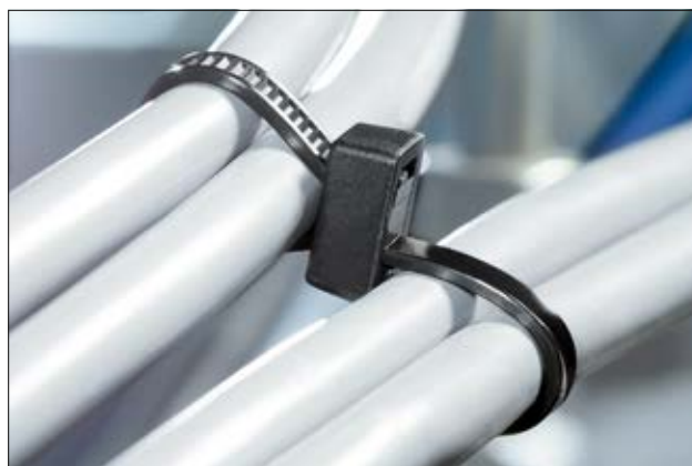
Zur Parallelbündelung mehrerer Leitungen eignen sich Kabelbinder der DH-Serie.