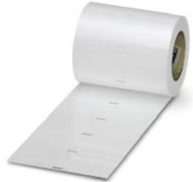
Bild zeigt Variante in weiß

http://eshop.phoenixcontact.at/phoenix/treeViewClick.do?UID=0800053