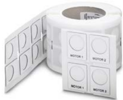
Bild zeigt Variante in weiß

http://eshop.phoenixcontact.at/phoenix/treeViewClick.do?UID=0801855