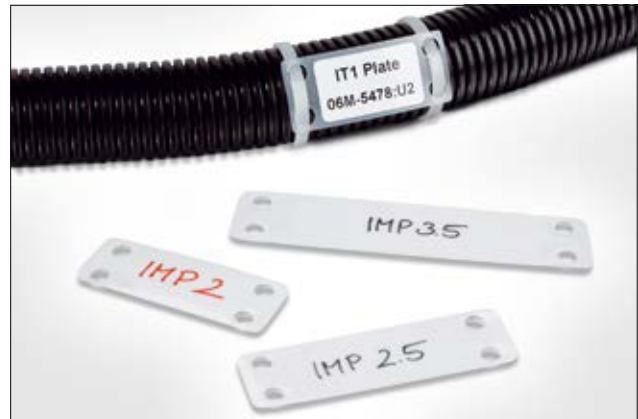
IT-/IMP-Plättchen – deutliche Lesbarkeit bringt Sicherheit.