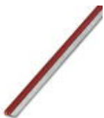
Endlossteckbrücke, Länge: 500 mm, Farbe: rot

Endlossteckbrücke - FBST 500-PLC RD - 2966786