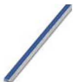
Endlossteckbrücke, Länge: 500 mm, Farbe: blau

Endlossteckbrücke - FBST 500-PLC BU - 2966692