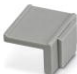
Geräte-Kennzeichnungsschild, Breite 12 mm