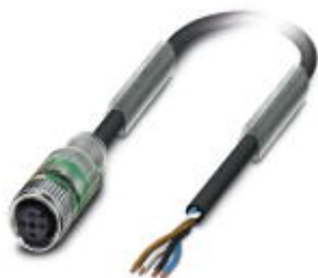
Sensor-/Aktor-Kabel, 4-polig, PUR halogenfrei, schwarzgrau RAL 7021, freies Leitungsende, auf Buchse gerade M12, A-kodiert, mit 2 LEDs, Kabellänge: 10 m

Bitte beachten Sie, dass die hier angegebenen Daten dem Online-Katalog entnommen sind. Die vollständigen Informationen und Daten entnehmen Sie bitte der Anwenderdokumentation. Es gelten die Allgemeinen Nutzungsbedingungen für Internet-Downloads. ( http://phoenixcontact.de/download )