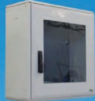
IM-4/KS + Glas-IM-4/KS