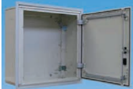
IM-4/KS + UM/Al-75/75