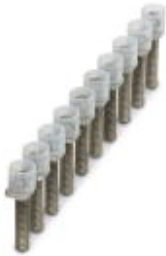
Brücke, Rastermaß: 10 mm, Polzahl: 10, Farbe: silberfarben

Bitte beachten Sie, dass die hier angegebenen Daten dem Online-Katalog entnommen sind. Die vollständigen Informationen und Daten entnehmen Sie bitte der Anwenderdokumentation. Es gelten die Allgemeinen Nutzungsbedingungen für Internet-Downloads. ( http://phoenixcontact.de/download )