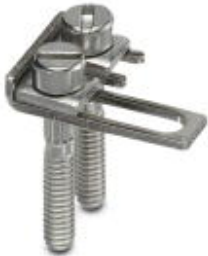
Schaltbrücke, Rastermaß: 8,2 mm, Polzahl: 2, Farbe: silberfarben

Bitte beachten Sie, dass die hier angegebenen Daten dem Online-Katalog entnommen sind. Die vollständigen Informationen und Daten entnehmen Sie bitte der Anwenderdokumentation. Es gelten die Allgemeinen Nutzungsbedingungen für Internet-Downloads. ( http://phoenixcontact.de/download )